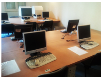
Salle de généalogie des archives départementales de Meurthe-et-Moselle